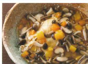
湯葉のきのこあんかけ