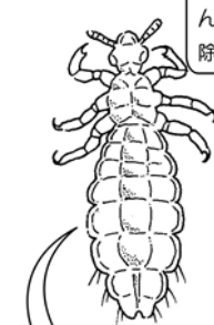
成虫：ふつうのシャンプーで取り除けます。

アタマジラミは、ノミヤカのような吸血昆虫で、成虫、幼虫ともに頭皮から血を吸います。血を吸われた側頭部から後頭部にかゆみが出ますが、寄生直後ではなく、繁殖を始める1か月後くらいから症状がでます。